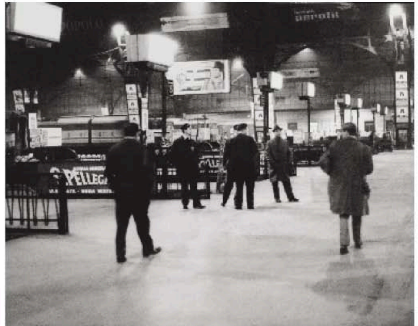
Stazione Centrale, Milano, s.d.

Quattrocentomila sono emigrati dal 1951 al '61.