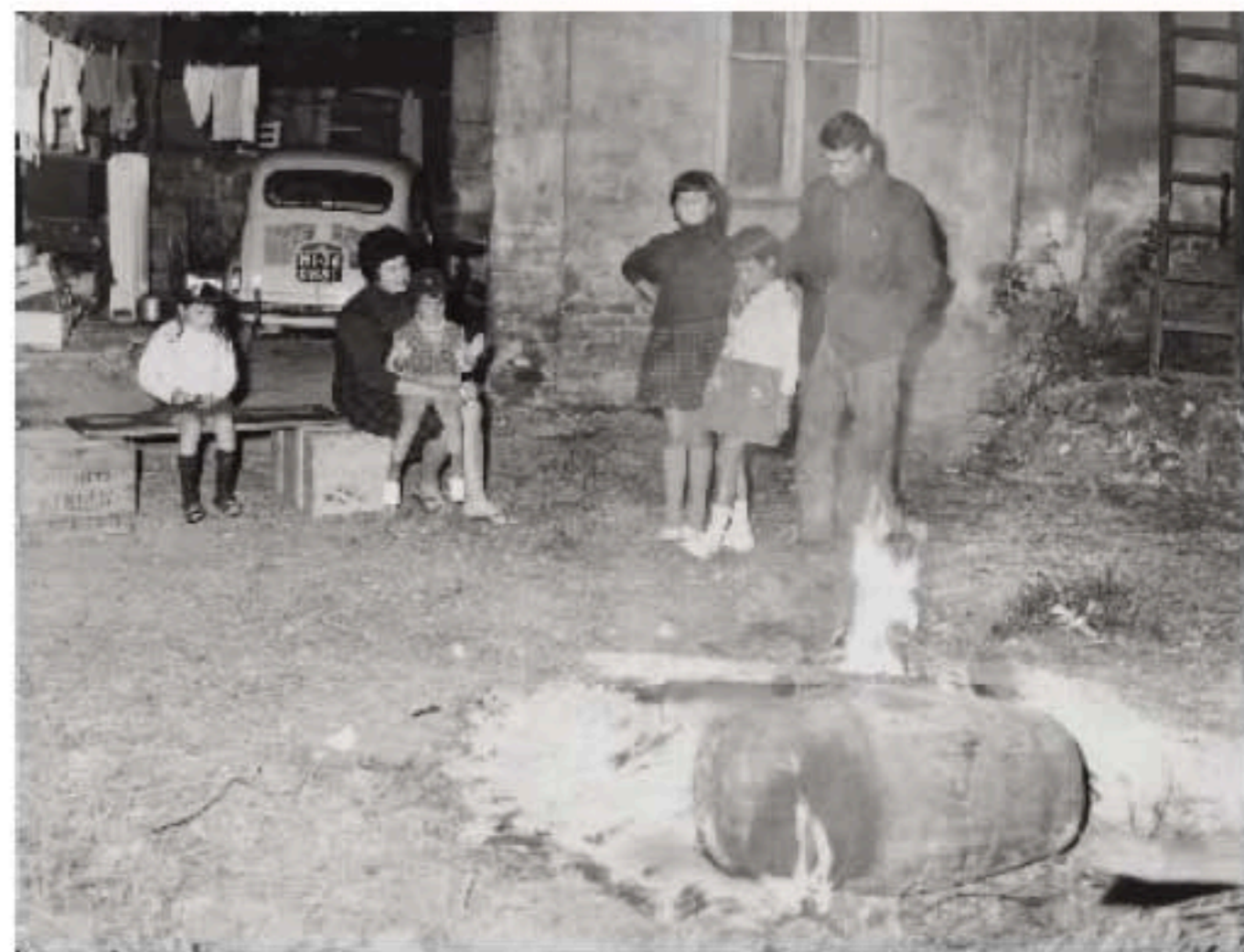
Famiglia senza casa dopo lo sfratto Milano, 28 ottobre 1963

Nella pagina precedente Famiglia senza casa dopo lo sfratto Milano, 1965 ca.