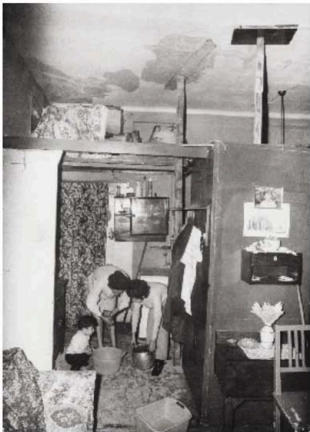
Nella pagina a fronte Casa pericolanti in via Gola 5 Milano, 29 settembre 1970