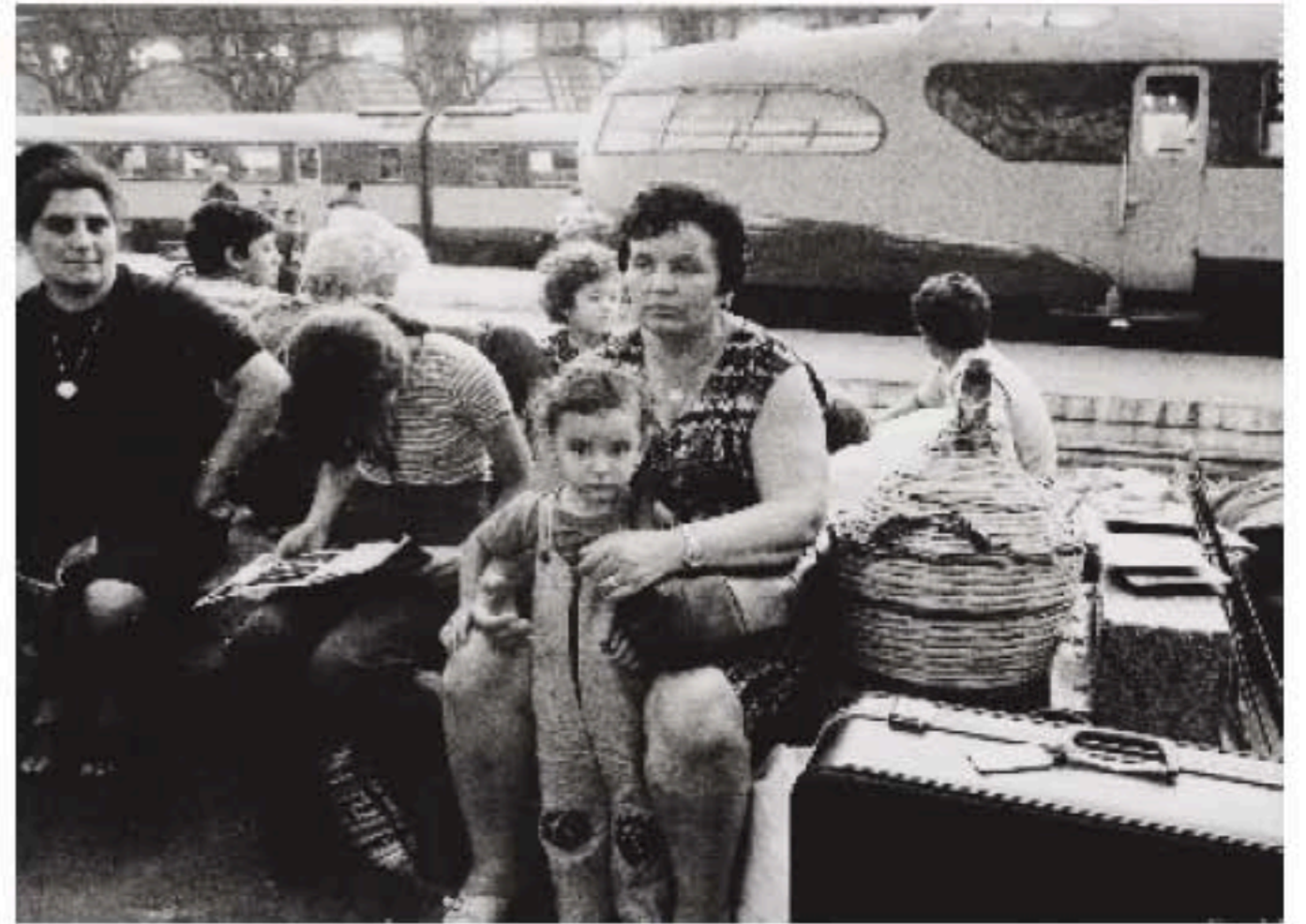
In alto e nella pagina a fronte Agenzia De Bellis Stazione Centrale Milano, s.d.