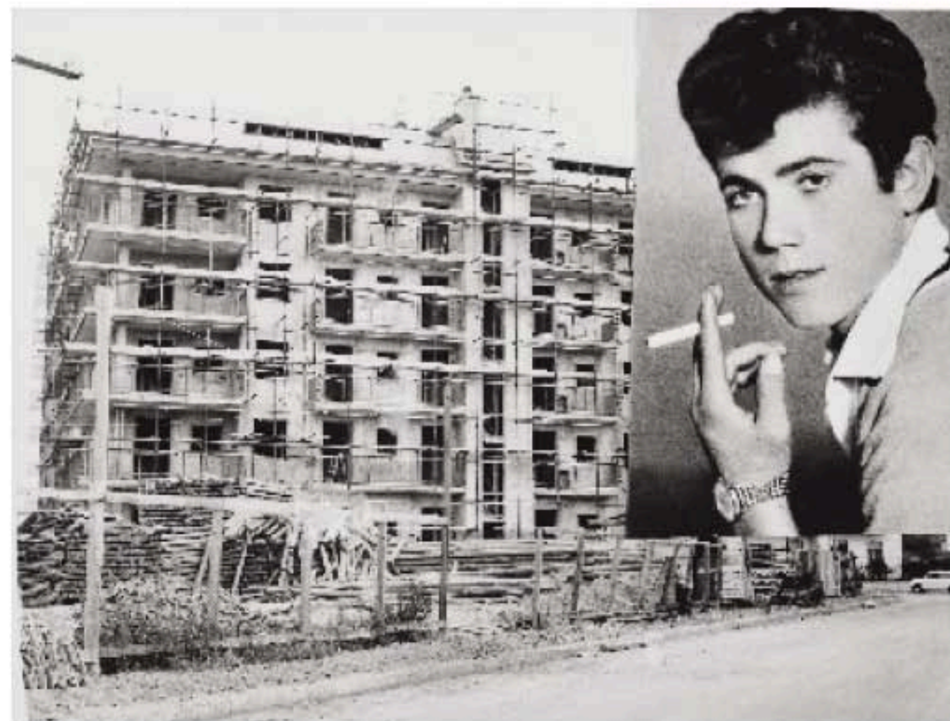
Infornio mortale in un cantiere Milano, 10 luglio 1963